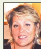
par Marie Ganozzi

En cette veille de 1 er mai, la chasse aux immigrés, à leurs enfants, aux jeunes, aux pauvres, à tous les "sans" ... est ouverte. Les attaques portées contre les populations les plus fragiles sont un des axes de la campagne menée par l'ex-ministre de l'intérieur ; les arrestations d'élèves devant les écoles nous remettent en mémoire «les rafles» organisées en d'autre temps contre d'autres populations.